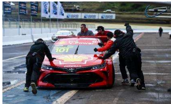
5ª etapa | Interlagos - SP