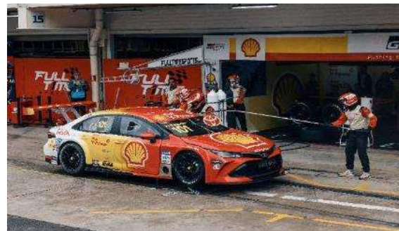
6ª etapa | Velocitta - SP