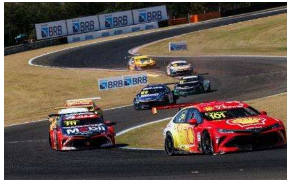
7ª etapa | Goiânia - GO