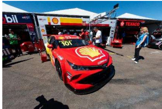
9ª etapa | Buenos Aires - Argentina