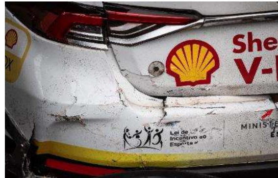
12ª etapa | Interlagos - SP