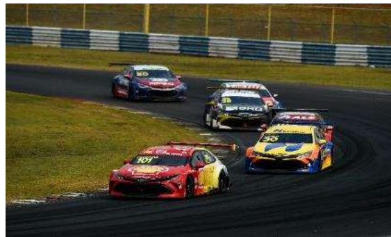
8ª etapa | Velopark - RS