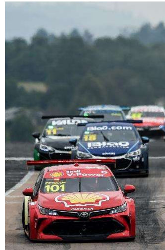
4ª etapa | Cascavel - PR