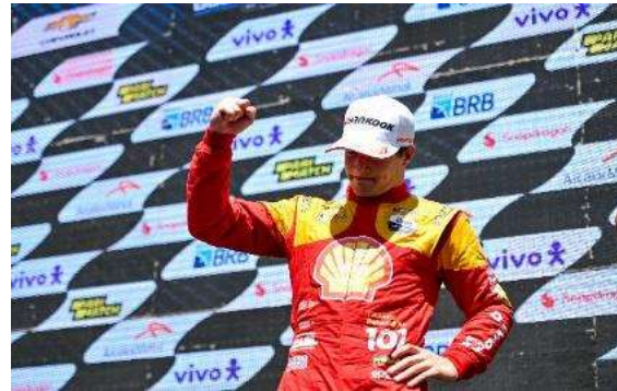
10ª etapa | Velocitta - SP